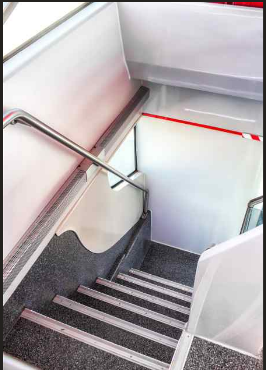
Comodidad y amplitud en los accesos al piso superior-escaleras